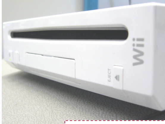
So groß wie ein Computer-DVD-Laufwerk

Dingern (den Wii-Remote Controllern) in der Hand wird geschlagen, geschoben, gedreht usw.. Das neuartige Spielkonzept fällt auf und ist sehr Spaßig. Wenn man mit Freunden oder Schülern einmal gemeinsam eine Runde Boxen, Tennis, Baseball oder Bowling gespielt hat, ist klar, was mit Spaßig gemeint ist. Zusätzlich bietet die Wii etwa ein halbes Gigabyte internen Speicherplatz. Hier können beispielsweise die eigens erstellten „Zusatzpersönlichkeiten“, die Mii's, gespeichert werden, die Wii-Fotopinnwand wird mit Bildern gefüllt. Um mit Schülern