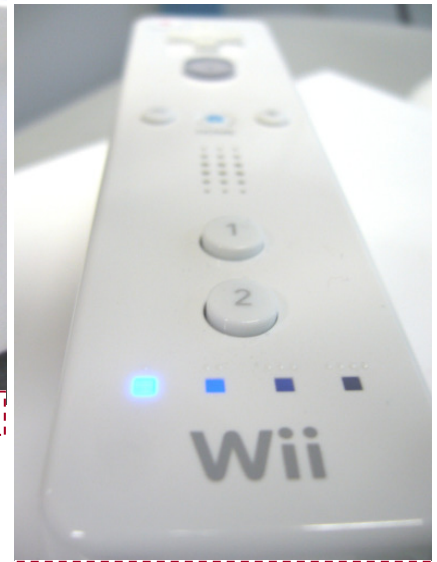
Wii – Remote Controller – Bis zu vier Spieler können miteinander spielen.

beispielsweise den letzten Tagesausflug an die Nordsee durchzusprechen, ein Referat zu präsentieren, Arbeitsergebnisse zu zeigen, kann der SD-Slot genutzt werden. Speicherkarte einlegen und den Wii-Fotokanal auswählen. Bei entspannter Musik wird nun die Präsentation gestartet und wird zu einem beeindruckenden Erlebnis. Die Bilddateien können auch als Puzzle für ein klei-